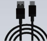
● Cabo de dados